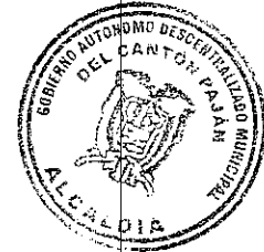
Lcdo. Galo Atahualpa Borbor Flores ALCALDE GADM DEL CANTÓN PAJÁN

POR EL COMITÉ CENTRAL ÚNICO DE TRABAJADORES Y EL SINDICATO ÚNICO DE TRABAJADORES MUNICIPALES DEL CANTÓN PAJÁN